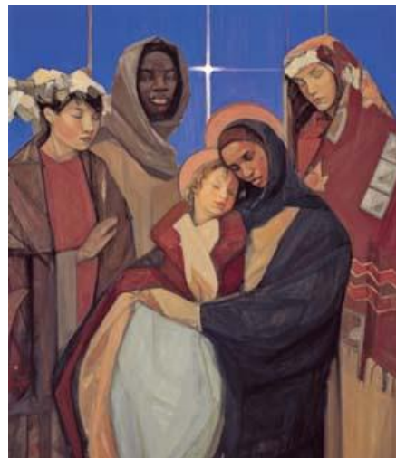
Épiphanie par Janet McKenzie – Le Pont qui Construit des Icônes